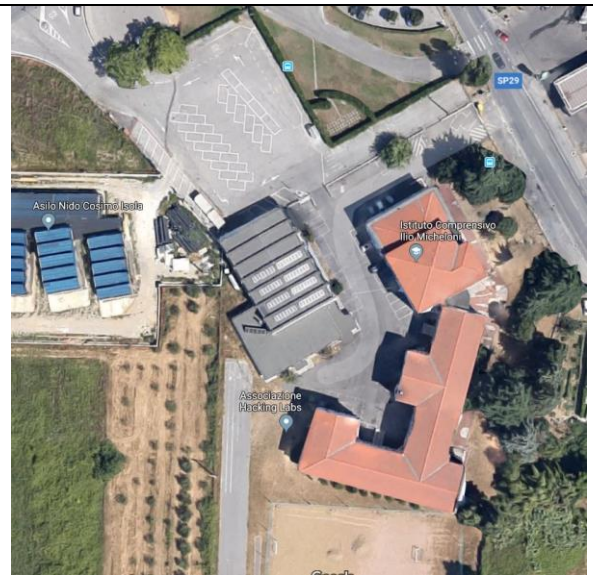
Istituto Comprensivo Ilio Micheloni Lammari